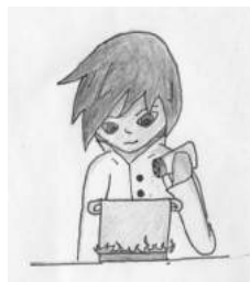
Viviane Fissler, Projektwoche 2018

Klassen: 5—7 (Koch 1) und 7—10 (Koch 2) Ort: Küche am Berg Zeit: (Koch 1) Dienstag, 13.00 – 15.00 Uhr (Koch 2) Mittwoch, 13.00 – 15.00 Uhr Leitung: Herr Bock Beginn: siehe Aushang Kosten: je nach Essen wird ein Kostenbeitrag von Ca. 1-4 € fällig.